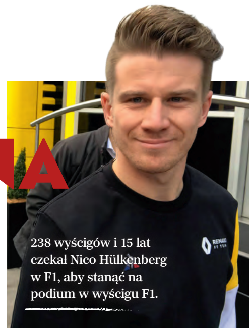
238 wyścigów i 15 lat czekał Nico Hülkenberg w F1, aby stanąć na podium w wyścigu F1.

Jedno jest pewne – emocji nie zabraknie. ▀