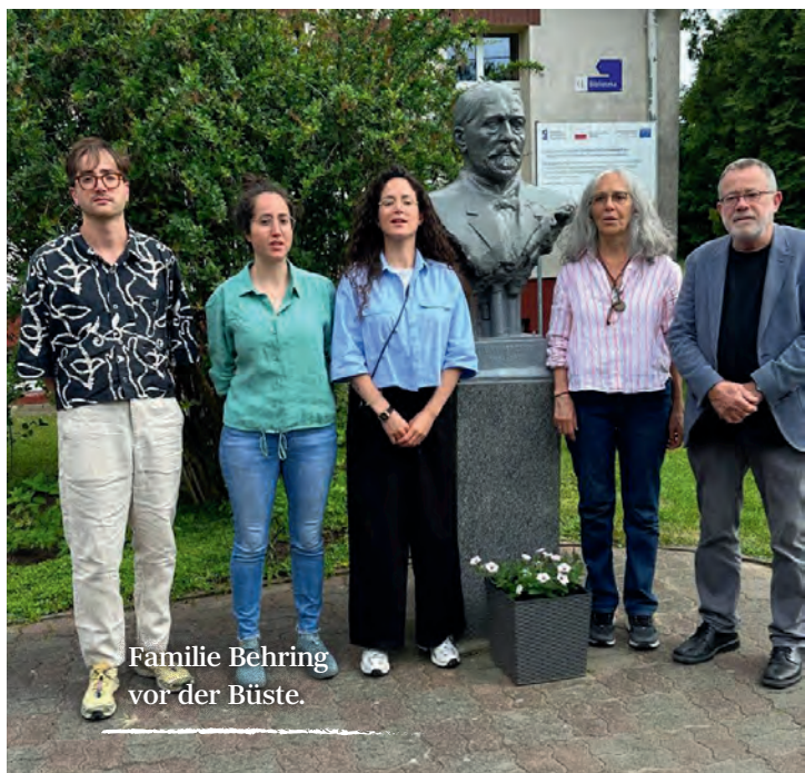
Familie Behring vor der Büste.