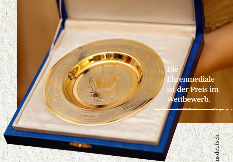
Die Ehrenmedaille ist der Preis im Wettbewerb.