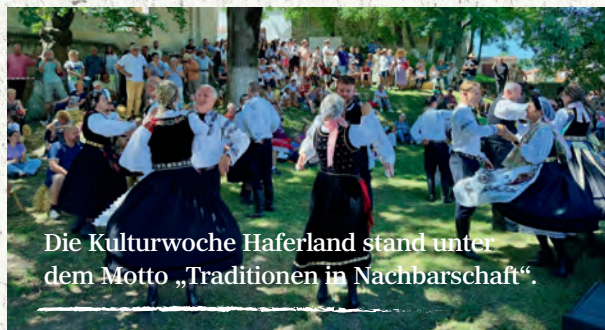
Die Kulturwoche Haferland stand unter dem Motto „Traditionen in Nachbarschaft“.

Nicht alle Projekte deutscher Minderheiten müssen länderübergreifend sein. Ein Beispiel dafür war die „Kulturwoche Haferland“.