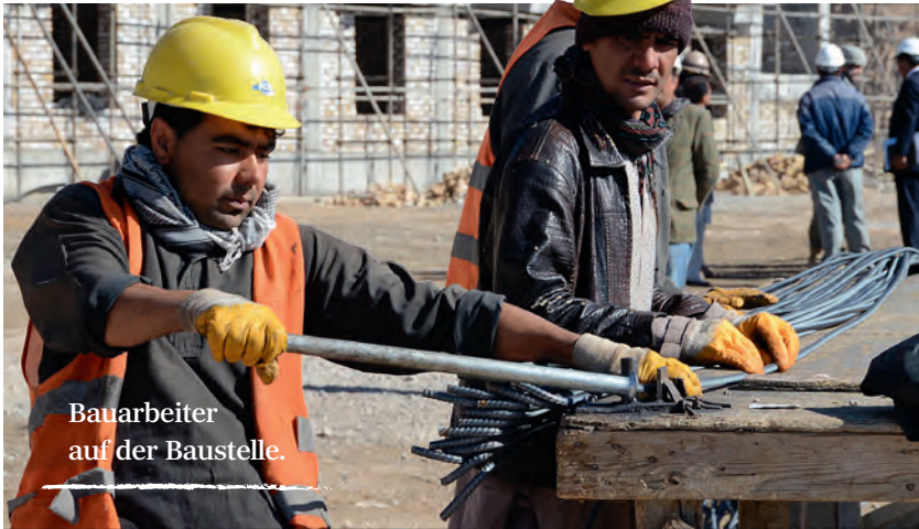
Bauarbeiter auf der Baustelle.