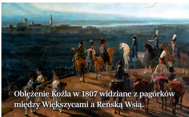
Oblężenie Koźła w 1807 widziane z pagórków między Więszycami a Reńską Wsią.

Cofnijmy się zatem o 220 lat. W Europie panowała wojna wywołana przez Napoleona, który złamał postanowienia pokoju ze Świętym Cesarstwem Rzymskim Narodu Niemieckiego. Cesarstwo składało się z wielu księstw i państweczek, takich jak Księstwo Bawarii czy Księstwo Hanoweru. Wojska francuskie przekroczyły granicę tego ostatniego, a księstwo hanowerskie było rządzone przez króla angielskiego i tak wybuchła wojna angielsko-francuska, która szybko objęła kolejne państwa. Austria przystąpiła do wojny 9.08.1805 r. ze względu na zagrożone interesy w północnych Włoszech, gdzie Napoleon ogłosił się królem nowoutworzonego przez siebie Królestwa Włoch. Mały Kapral, mając przeciwko sobie Anglię, Austrię, Prusy i Rosję, postanowił pozyskać nowych sojuszników wchodzących w skład I Rzeszy i zwrócił swoją uwagę na Księstwo Elektorskie Bawaria.