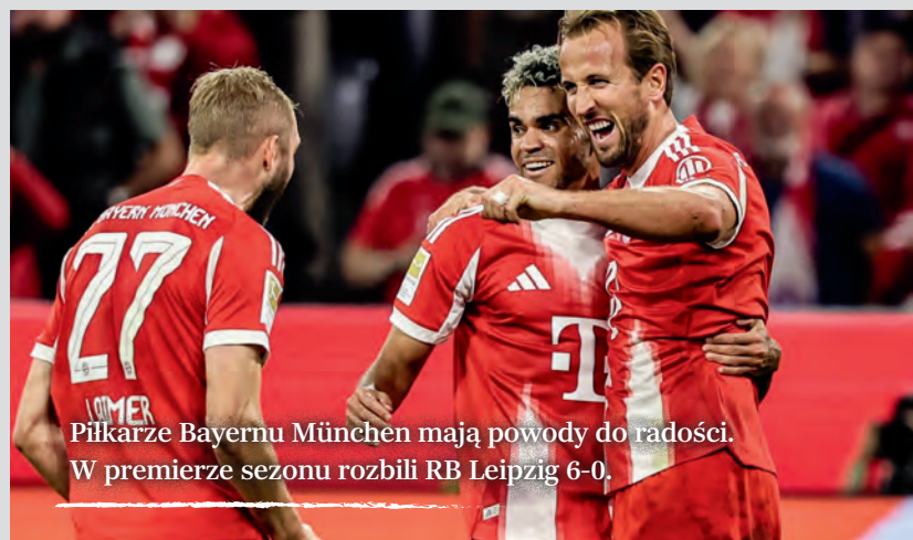
Piłkarze Bayernu München mają powody do radości. W premierze sezonu rozbili RB Leipzig 6-0.