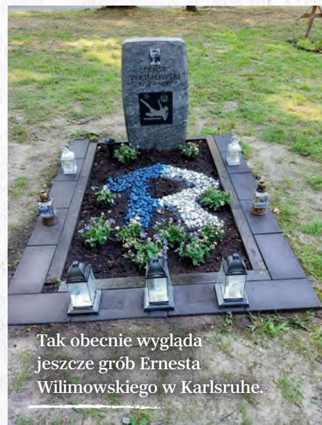
Tak obecnie wygląda jeszcze grób Ernesta Wilimowskiego w Karlsruhe.

Zebrane środki pozwolą także na zakupienie nowej trumny, postawienie nagrobku i przeprowadzenie ekshumacji, do której dojdzie 30 sierpnia 2025 roku. Tego samego dnia – jak informują kibice Ruchu Chorzów z Fan Club Deutschland – odbędzie się uroczystość pogrzebowa. Weźmie w niej udział rodzina Ernesta Wilimowskiego, kibice, władze samorządowe oraz historycy sportu, którzy oddadzą hold „Śląskiemu Kaiserowi”. ▀